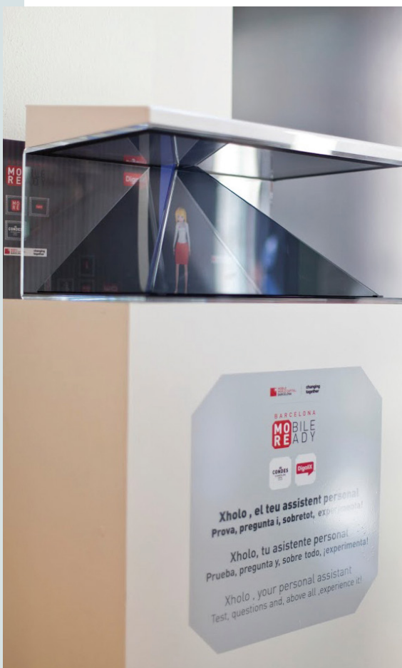
XHolo és un nou producte creat recentment per DigaliX. És un assistent en versió hologràfica que pot interactuar amb l'usuari de manera tàctil i per veu.

Barcelona Tech City, clúster d'empreses i professionals tecnològics i digitals, amb seu pròpia i amb el suport de la Generalitat i l'Ajuntament de Barcelona, demostra que és així.